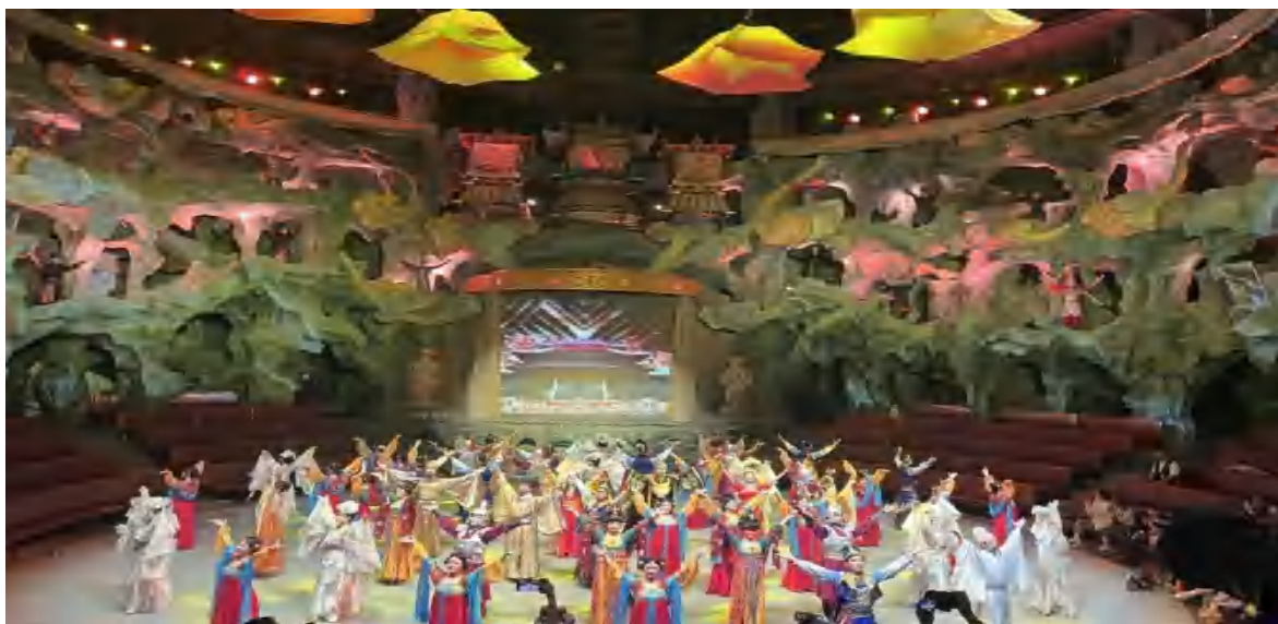
图 21 参加《盛世唐城之大唐倚梦》演出

台上一分钟，台下十年功，大家按照导演组要求仔细琢磨动作队形，反复练习，确保高质量、高水准地完成演出任务。为观众呈现出了一场震撼的视觉盛宴，让人身临其境沉浸式体验什么是“盛唐气象”。