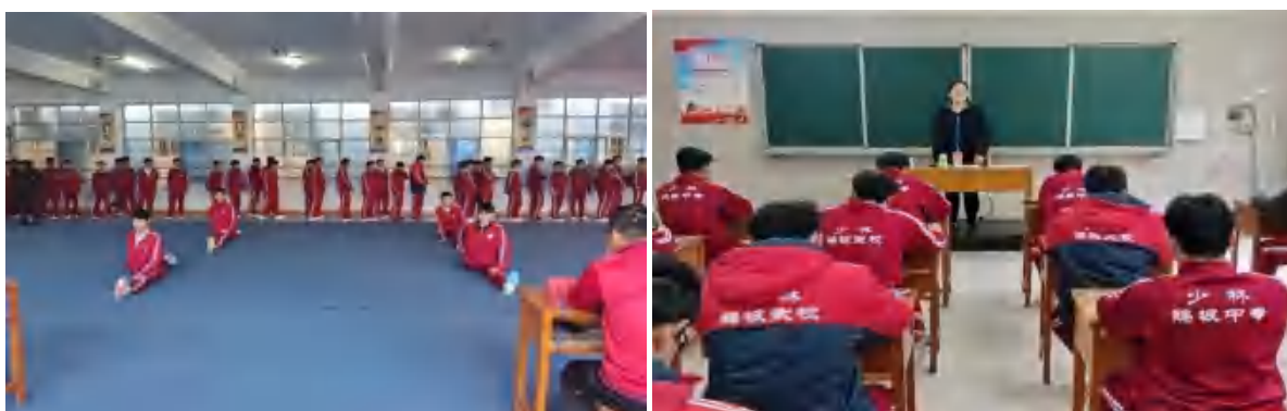
图 22 职业技能等级认定考核

根据河南省印发的《河南省教育系统落实“人人持证、技能河南”建设工作任务实施方案》的通知精神，2024 年学校认定 480 名社会体育指导员，确保学生在毕业时，取得毕业证和职业技能等级证书，实现双证双赢。