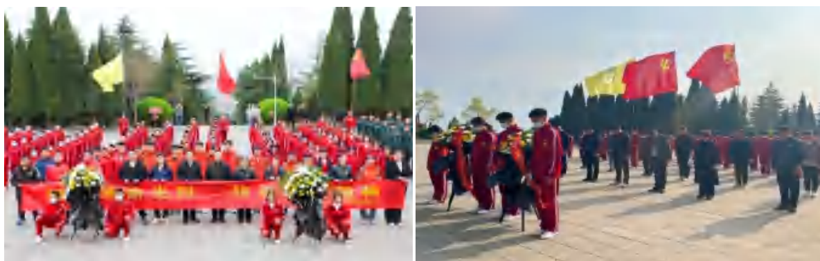
图 4 烈士陵园缅怀先烈

为进一步加强红色教育，缅怀革命先烈的丰功伟绩，寄托对革命先烈的哀思，培养学生的爱国主义精神和高尚情操。鹤坡中专党总支部组织党员、团员代表，到登封市烈士陵园举行“缅怀革命先烈，传承红色精神”为主题的清明节扫墓活动。