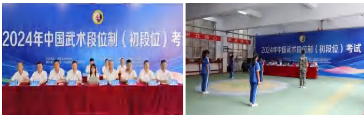
图 23 段位制考核