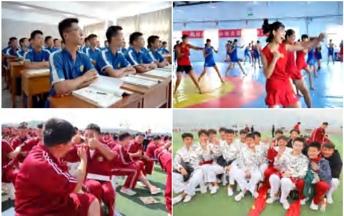
图 5 丰富多彩的校园生活

（4）完善的学生考核评价体系。学校坚持“一切从学生出发，一切为学生服务，为了学生的一切，为了一切的学生”的办学方针，统筹推进育人方式、办学模式、管理体制、保障机制改革，以推动学校教育高质量发展。深入推进教育评价改革，为在校生建立个人综合素质评价档案，实行综合素质量化积分管理，促使学生评价改革走深走实，助力学生实现德智体美劳全面发展。