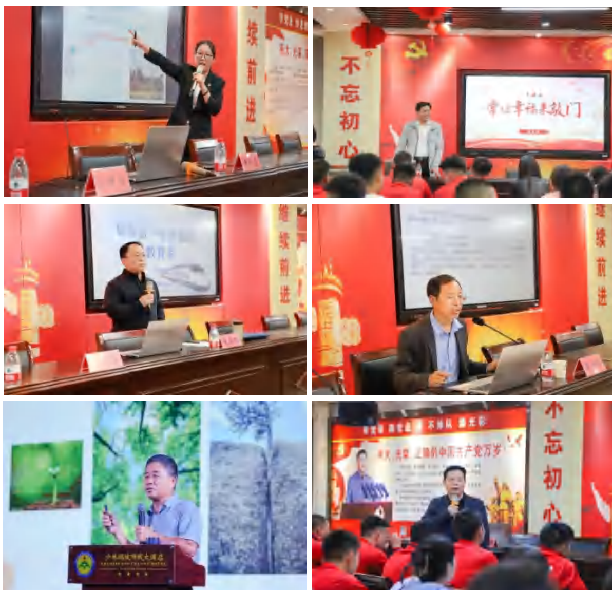
图 7 邀请名师、校长开展业务培训

强化师资培训，组织 59 名新教师参加入职培训；组织全体教师进行师德师风培训 17 次；推荐教师参加省级、市级培训，累计培训 21 人次。带领教师走进公办学校进行课程观摩，提升教师业务水平；邀请公办学校名师、校长做专题讲座，提高教师教学素养。邀请河体、河大的武术专家，对教练员进行专项技术指导，精准对接体育单招标准与要求。有效提高学校师资队伍的业务素质和能力水平。