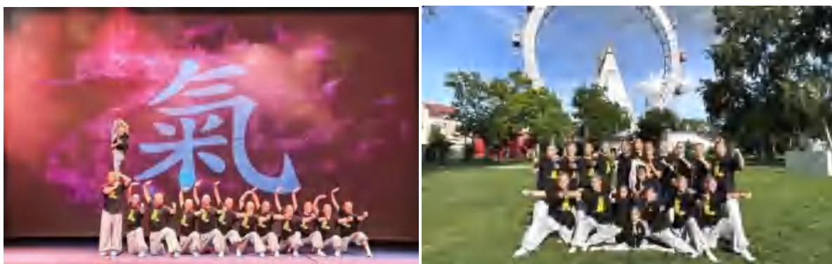
图 12 欧洲 12 国巡演

2024年4月，一支由鹅坡中专精心选派的武术文化使者团队踏上了前往欧洲的征程。从奥地利到比利时，再到德国等12个国家，鹅坡学子向世界展示了中国武术的独特魅力与深厚底蕴，成为中外文化交流中的一抹亮色。