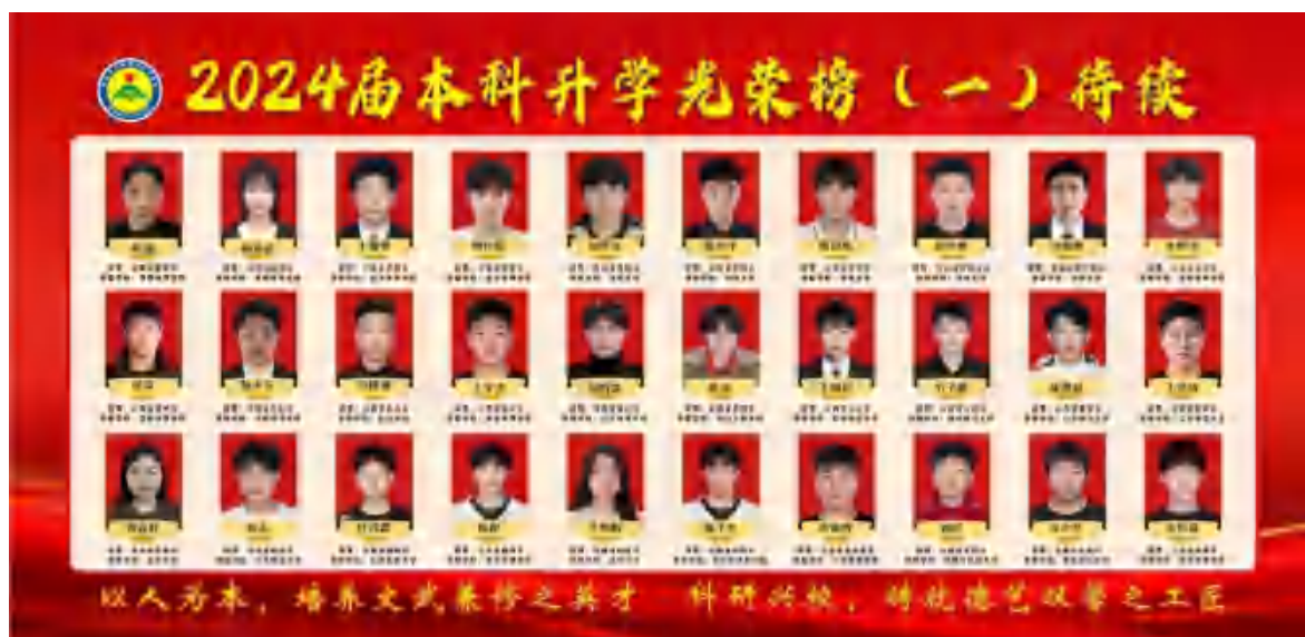
图 8 2024 年本科升学光荣榜