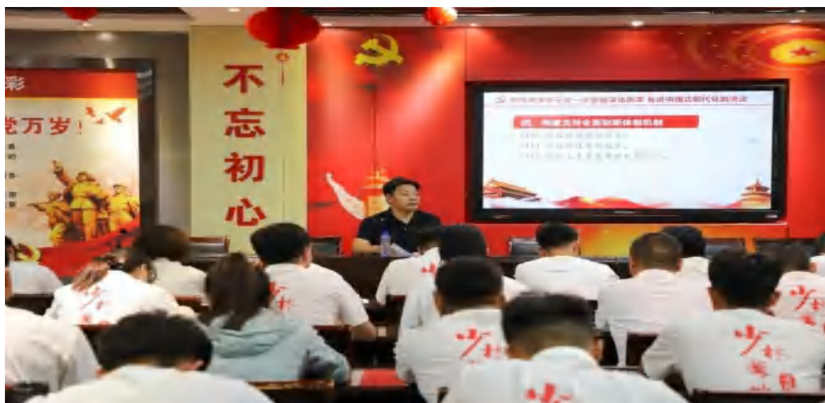
图 1 学校党员集中学习党的二十届三中全会精神

态领导权，确保正确的宣传导向。通过课堂、学校自媒体平台、《鹅坡之星》期刊、官网等宣传主阵地，增强学生主流意识形态的思想认同、情感认同和价值认同，确保课堂和校园始终是教书育人的沃土良田。