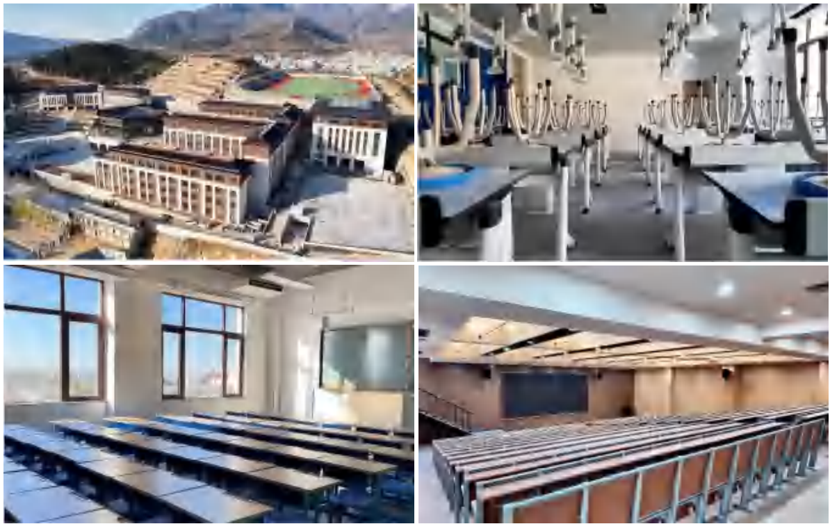
图 14 新校区校园环境

(2) 精神文化建设。学校以“振兴中华紧跟党走的爱国精神、勇立潮头敢为人先的首创精神、信念坚定百折不挠的执着精神、文武双修成就全才的育人精神、情系社会热心公益的济世精神”，培养学生良好思想品德和健全人格，内强素质，外树形象，促进学生养成良好行为习惯，多途径全方位提升学生综合素质，塑造具有学校特色的精神文化氛围。充分利用思政课、重大节日及第三课堂研学，组织开展爱党爱国爱校教育，培养鹅坡师生家国情怀。邀请优秀毕业生回校座谈，助力学生树立远大目标。评选鹅坡小雷锋、鹅坡小天使、鹅坡小卫士等榜样，发挥示范引领作用。推选优秀学生月踏嵩岳、月逛中原，激励学生争先争优。积极推动全校师生参与美丽鹅坡、少林鹅坡、文化鹅坡、多彩鹅坡、国际鹅坡建设，为学校高质量发展贡献力量。