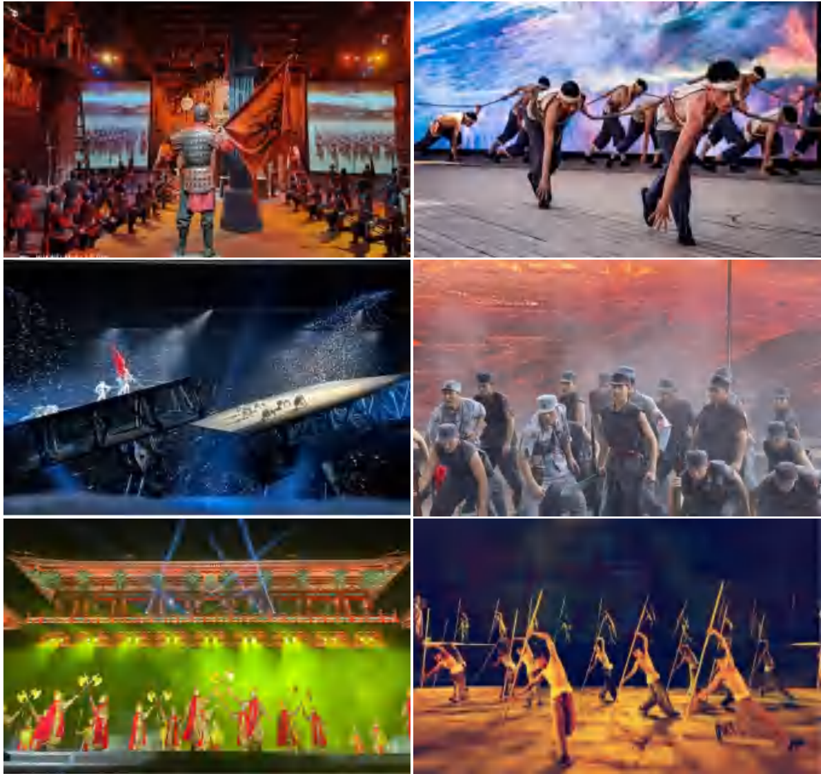
图 20 实习演出