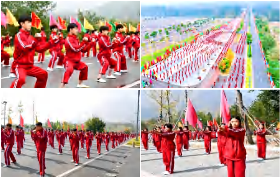
图 26 郑州国际少林武术节

由河南省人民政府主办，河南省体育局、郑州市人民政府共同承办的第十三届郑州国际少林武术节开幕备受关注的迎宾式在登封盛大呈现，近千名鹅坡学子组成不同方阵，精彩演绎舞龙舞狮、少林拳、少林养生八段锦、各种器械等少林绝技，用功夫绝活迎接四海宾客，以“功夫”迎客，与世界对话。