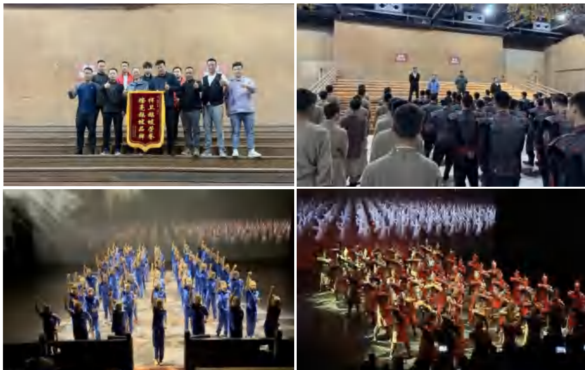
图 11 参演《复活的军团》

《复活的军团》是一部大型沉浸式历史剧，主要以秦始皇兵马俑为背景，通过现代舞台技术和表演艺术，再现了秦朝军队的辉煌与气势。剧中，鹅坡学子身着盔甲，挥动手中的兵戈，威武豪迈，磅礴有力，演绎着大秦帝国的波澜壮阔。