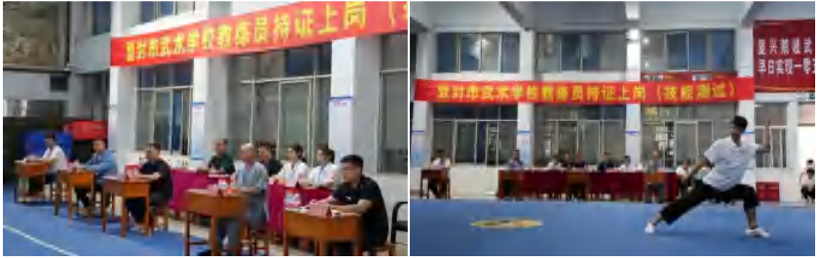
图 25 教练员持证上岗技能测试