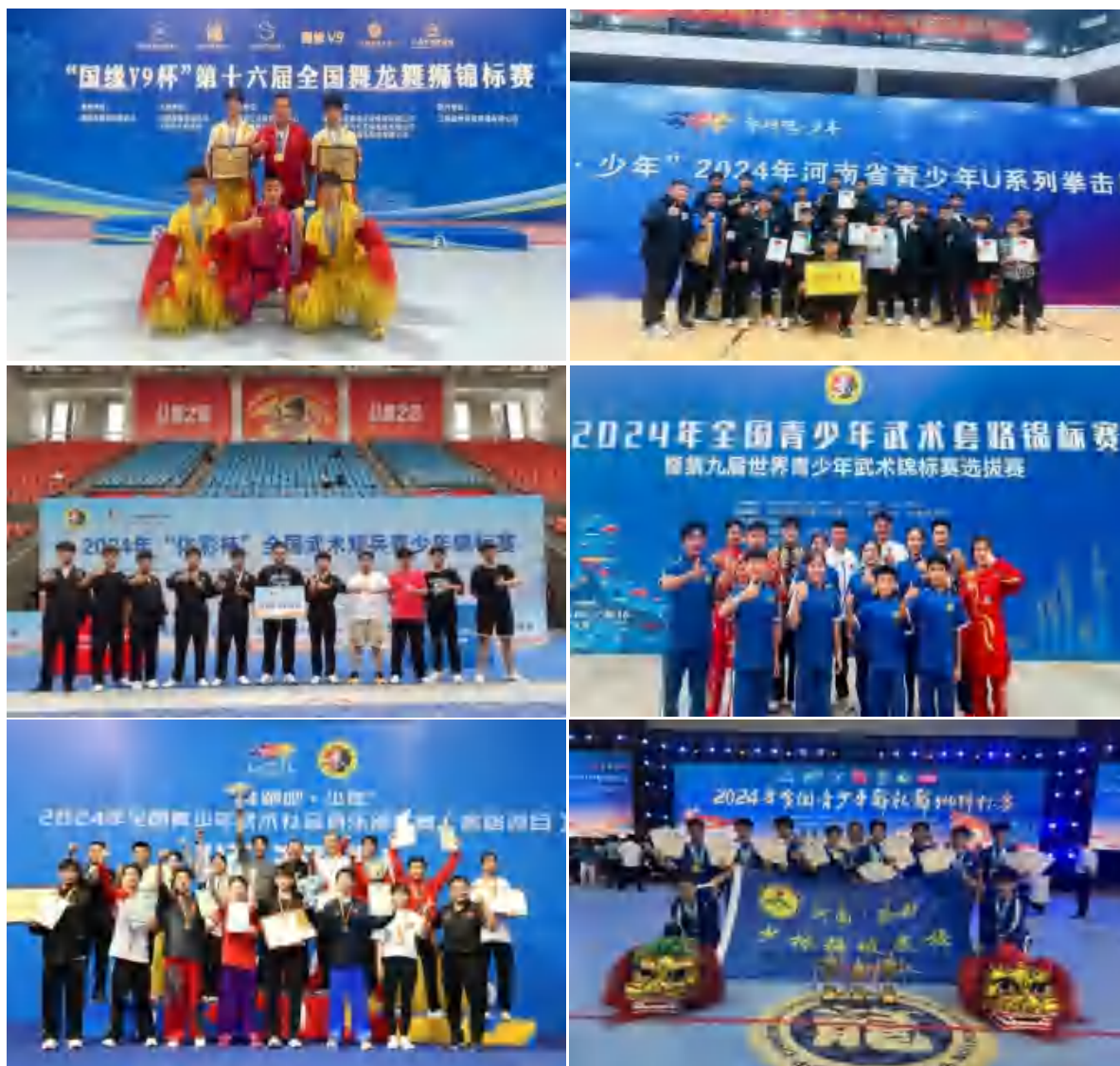
图 9 竞赛成绩

2024 年全国武术套路冠军赛（传统项目赛区），2 名学员荣获国家一级运动员称号；2024 年全国青少年武术套路锦标赛暨第九届世界青少年武术锦标赛选拔赛，5 名学员荣获国家一级运动员称号；2024 年全国青少年武术散打锦标赛暨第九届世界青少年武术锦标赛选拔赛，2 名学员荣获国家二级运动员称号；2024 年全国武术套路锦标赛暨第十届亚洲武术锦标赛选拔赛，2 名学员荣获国家运动健将称号，2 名学员荣获国家一级运动员称号；2024 年全国武术散打锦标赛（男子赛区、女子赛区）比赛，5 名学员