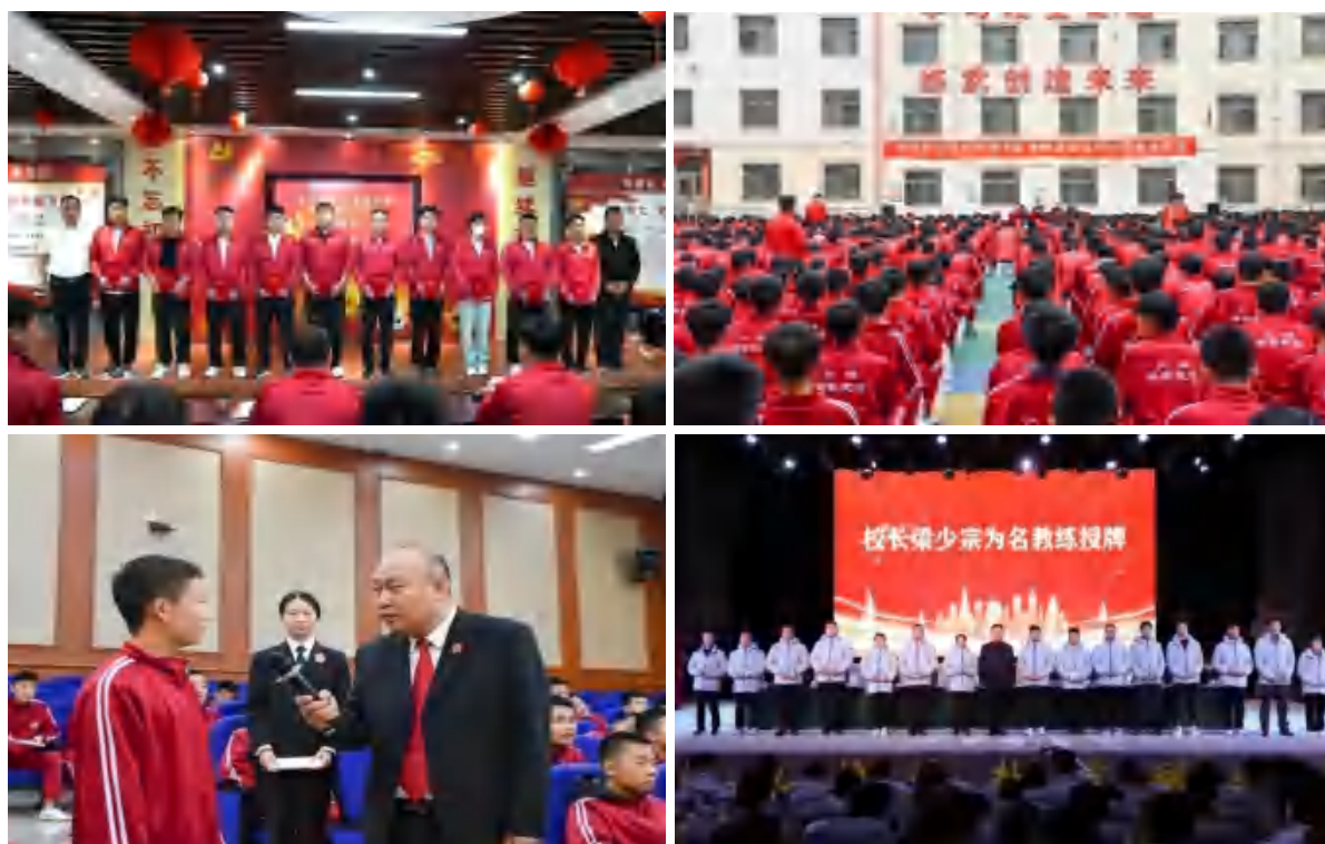
图 29 学校活动

多元举措，引导教师成为学生的“四有”好老师、“四个引路人”，当好新时代的“大先生”。组织教师教练赴郑州、新乡、许昌、三门峡等地，参加培训、调研。邀请不同领域专家对教职工开展政策法规、安全教育、教学管理、国学教学等方面的培训，全面提升教职工的综合素养。