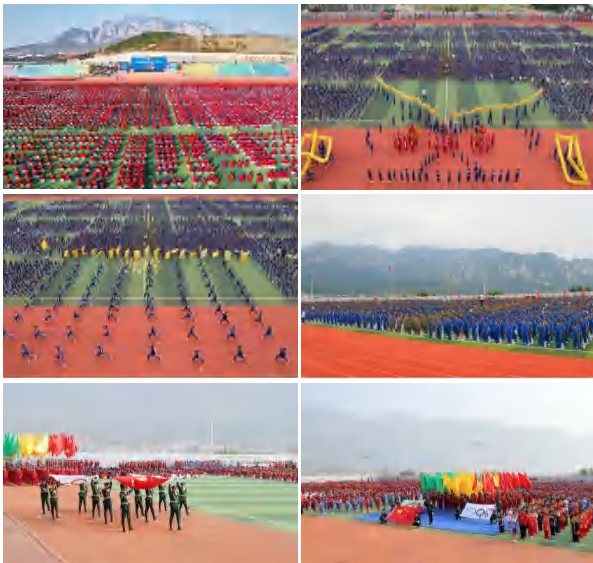
图 33 校运会