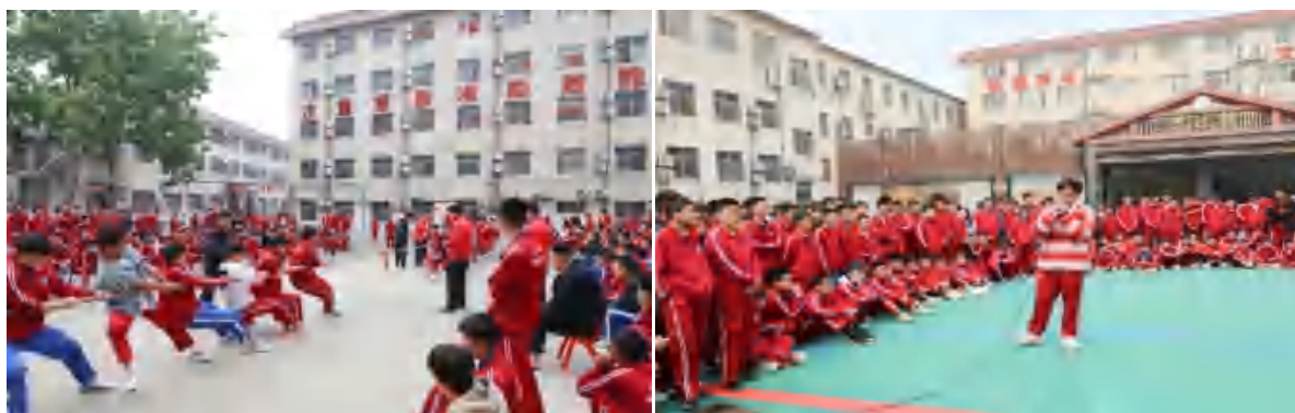
图 15 周日大舞台

结束了一周紧张的学习和训练，每到周日，训练场上都会呈现一派欢乐景象。教练和老师带领同学们举行拔河、抢凳子、吹气球、袋鼠跳、唱歌、跳舞、手语操等形式多样的活动，做到了“人人有项目、班班有活动”。同学们一个个乐在其中，玩得不亦乐乎。灿烂的笑脸，飞扬的青春，构成了一幅生机勃勃、满载希望、和谐融洽的幸福画卷。