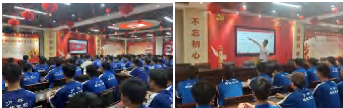
图 24 人人持证·技能河南培训工作

持续推动“人人持证·技能河南”的建设工作，做强培训主体，做优培训内容，有力确保“人人持证·技能河南”建设工作落地见效。2024年学校超额完成本年度专业技能人才培养任务，累计培训1245人。