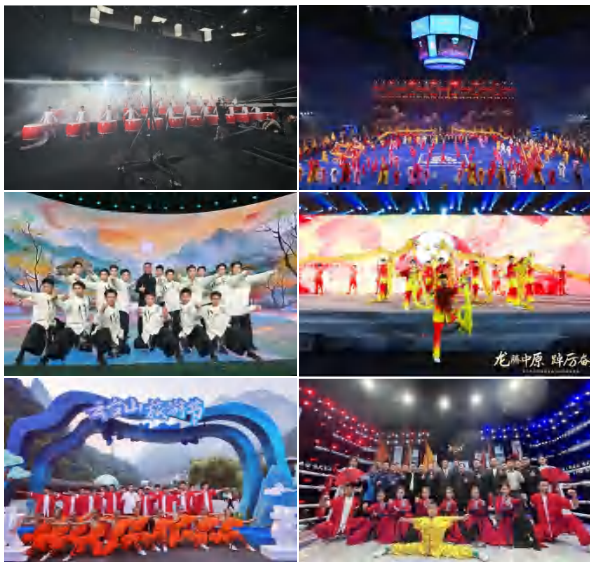
图 10 对外演出活动

亚洲大学生锦标赛开幕式、“咱村有戏”戏曲文化活动、豫见齐鲁-山河有约推广活动、巴里坤哈萨克自治县成立七十周年庆典活动、中国杏花村国际酒业博览会《汾酒之夜》、河南卫视“一带一路晚会”第三届一带一路知识产权高级别会议晚会、关公文化根亲节、“醉美金秋·相约焦作”云台山旅游节、国家级说唱文化（宝丰）生态保护试验区建设成果展等演出，充分发挥职业教育为社会、行业、企业服务的功能，为企业培养更多技能人才。