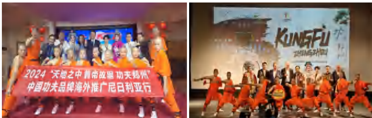
图 13 赴尼日利亚推广演出

演出环节，“天地之中、黄帝故里、功夫郑州”代表团向观众展示了精彩的武术表演，少林小子一登场，便赢得了现场观众的热烈的掌声，许多人站起来不停拍手叫好，“中国功夫”再次赢得了尼日利亚观众的心。