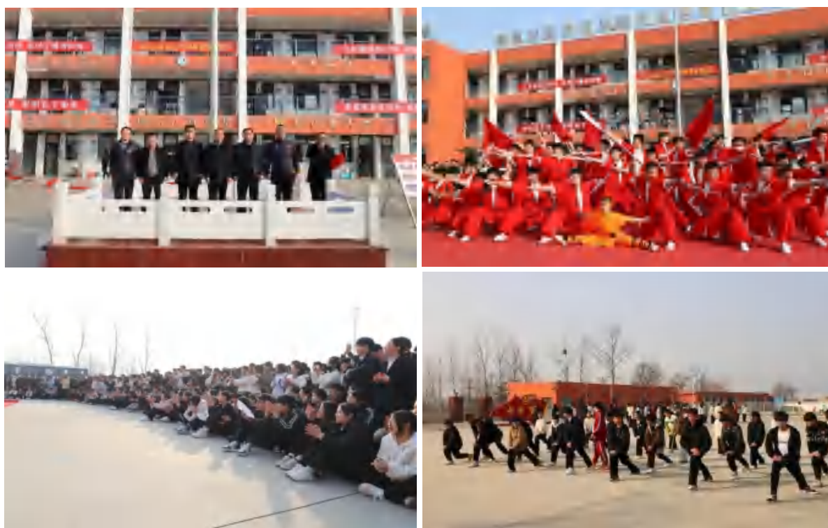
图 16 武术进校园

术进校园活动。学校组织优秀的教练团队，走进市直第一初级中学、市直第四初级中学，市直第九初级中学、卢店镇初级中学、东华镇初中、北区小学、爱民路幼儿园等学校，累计培训人数达3000余人次，为登封市中小学生普及中华传统武术文化。