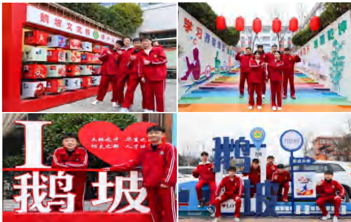
图 28 校园文化角

构建以《章程》为核心、制度规范为基础、内控防控为抓手、法治文化为底蕴的依法治校工作格局，不断完善修订各项制度建设，推进规章制度“废改立释”，确保各项制度文件合法合规、适用有效。健全风险排查机制，按照“关口前移、源头介入、全程参与”的风险防控布局，以平安校园建设为抓手，建立健全安全稳定风险隐患排查机制，营造安全稳定的校园环境。