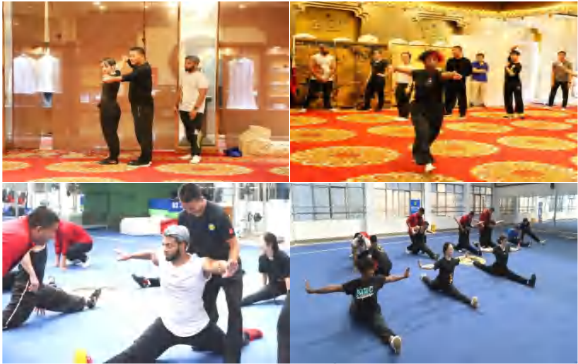
图 18 训练营成员进行武术训练

中美青少年武术精英训练营，不仅为外国友人提供了一个展示武术才华的舞台，更为中美文化交流搭建了一座桥梁。在接下来的几天里，训练营将组织学员参观登封的著名景点，通过这些丰富多彩的活动，让学员们在提升武术技能的同时，深入感受中国文化的魅力，促进两国青少年之间的文化交流，加深彼此的友谊。