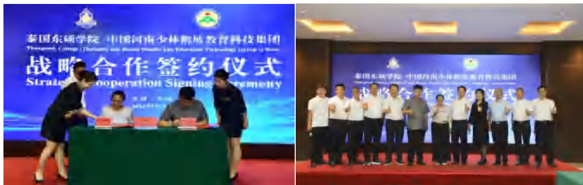
图 19 与泰国东硕学院签订战略合作协议