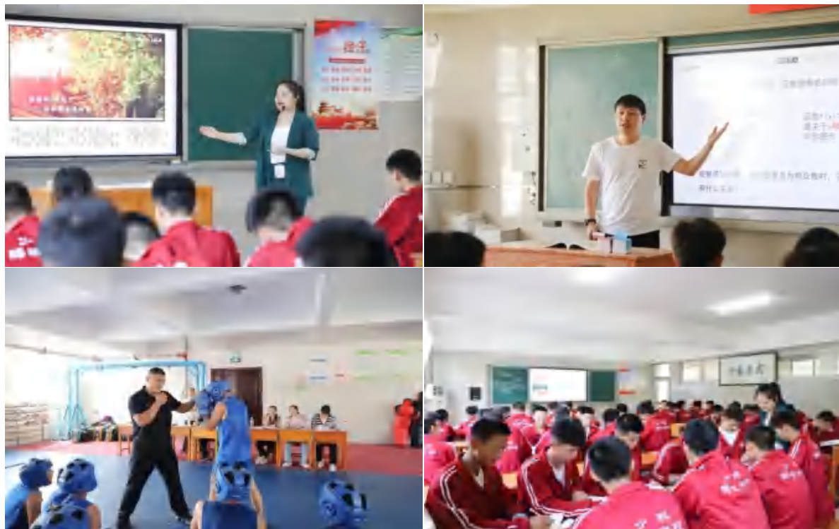
图 6 优质课评比