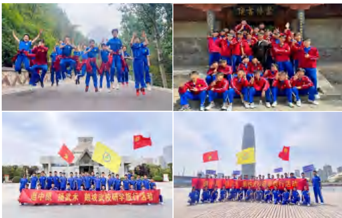
图 2 月踏嵩岳、月逛中原

生“勤、能、德、绩”组建四人小队，充分发挥楼层八员职能，借量化积分考核激发学生参与积极性，规范哨子路队秩序，培育优良校风。重视先进典型的示范引领，邀请优秀毕业生回校分享，推选优秀班干部、三好学生，评选“我爱鹅坡”“见义勇为”等优秀学生，组织优秀学子月逛中原、月踏嵩岳，以形成良好学风。