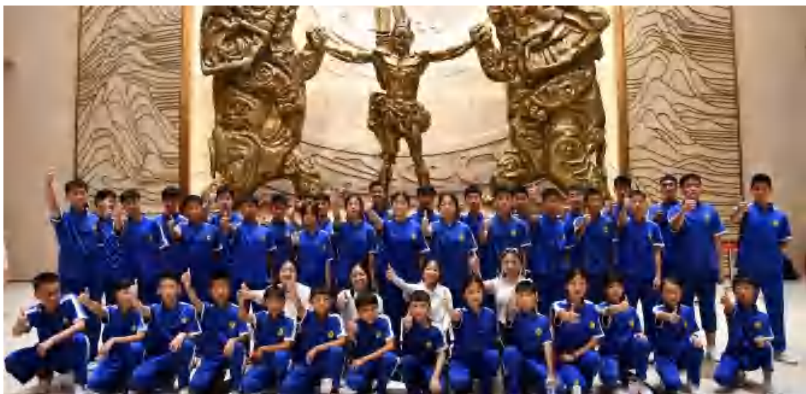
图 3 月逛中原活动

未来，学校将继续开展各类丰富多彩的活动，不断提升鹅坡学子综合素质和能力，培养更多有理想、有本领、有担当的新时代好少年。