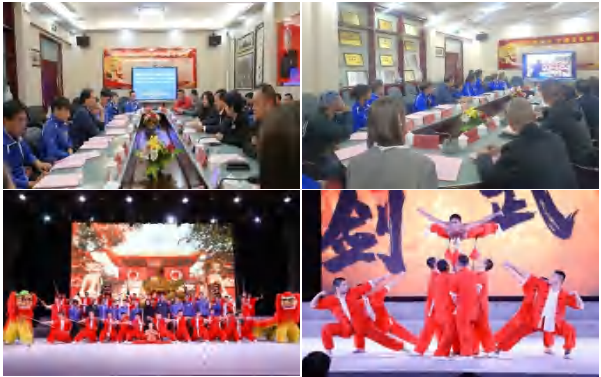
图 17 中美青少年武术精英训练营