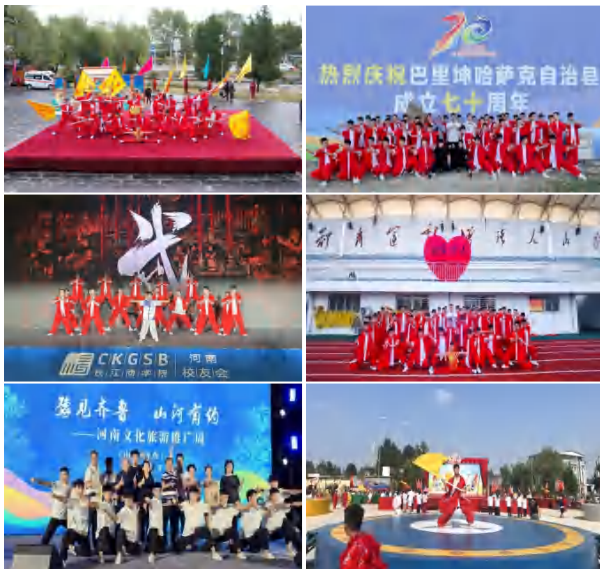
图 27 武术展演

学校以弘扬中国武术文化为使命，积极响应市委市政府促进文化旅游业高质量发展的号召。在登封嵩阳景区开展武术展演，赴巴里坤哈萨克自治县进行援疆演出，走进浙江大学、南京大学、复旦大学等高校，进行“行走河南·读懂中国”宣传推广演出等系列活动，为郑州文旅事业蓬勃发展贡献自己的力量。