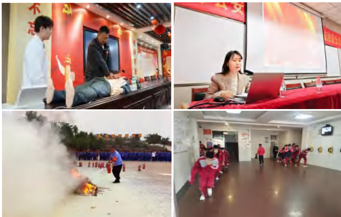
图 31 学生开展健康、消防培训

好合作单位工作人员，进行安全法制、心理健康、防电诈、防传染病、女生青春期教育。常态化开展心肺复苏培训、消防、防踩踏、防震等应急疏散演练，全面提高师生应急处置能力与自我保护能力。发挥校团委和学生会职能，激发学生主人翁意识和参与管理服务意识。充分借助思政课这一主阵地，深入挖掘重大节日这一教育资源，积极拓展第三课堂研学活动，组织开展形式多样、内涵丰富的爱党爱国爱校教育系列活动。